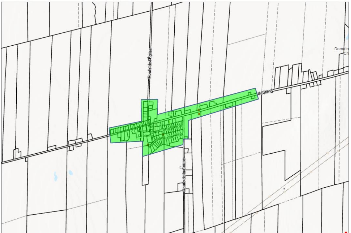
Extrait matrice graphique